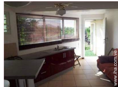
vista desde la cocina