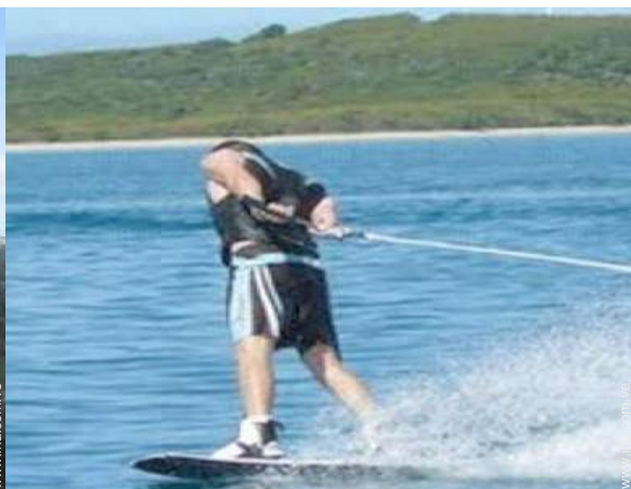
actividades de ocio cercanas