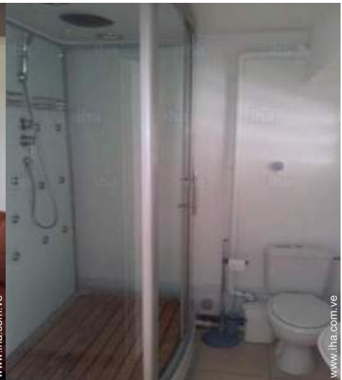
Instalaciones a disposición