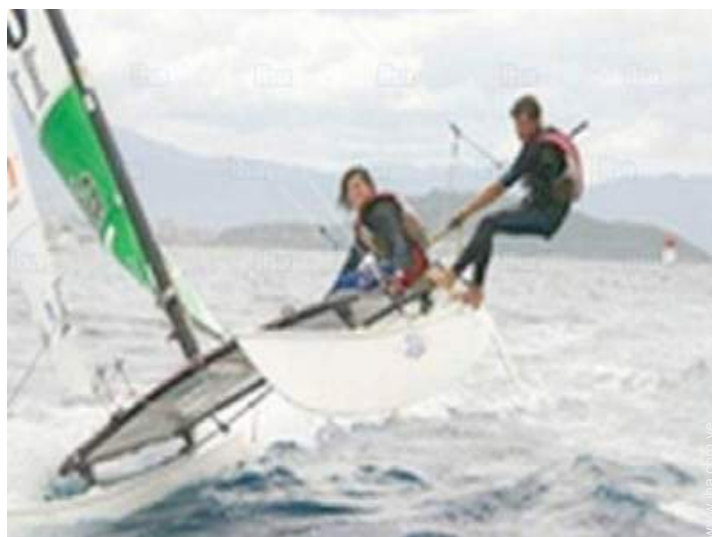
actividades balnearias cercanas