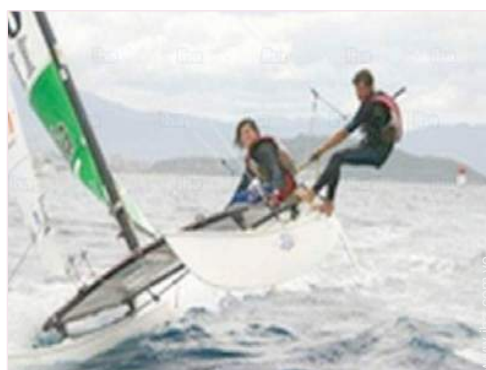
actividades balnearias cercanas