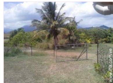
vista sobre el campo