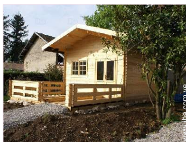
Cabaña Bungalow con Encanto