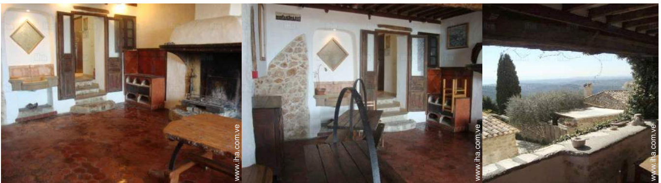
vista desde el apartamento