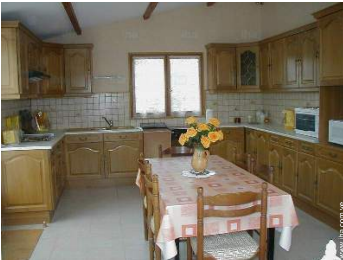
gran cocina independiente