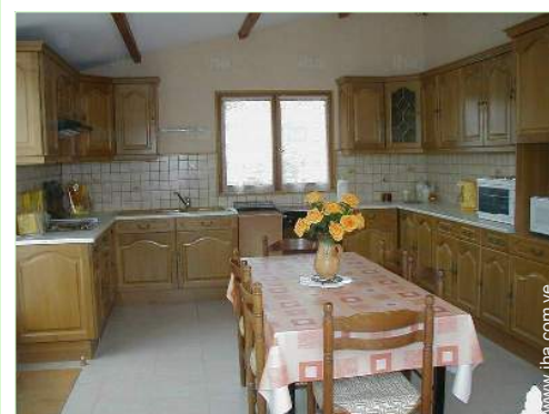
gran cocina independiente

Doctor 4km Enfermera 1,5km Hospital 25km