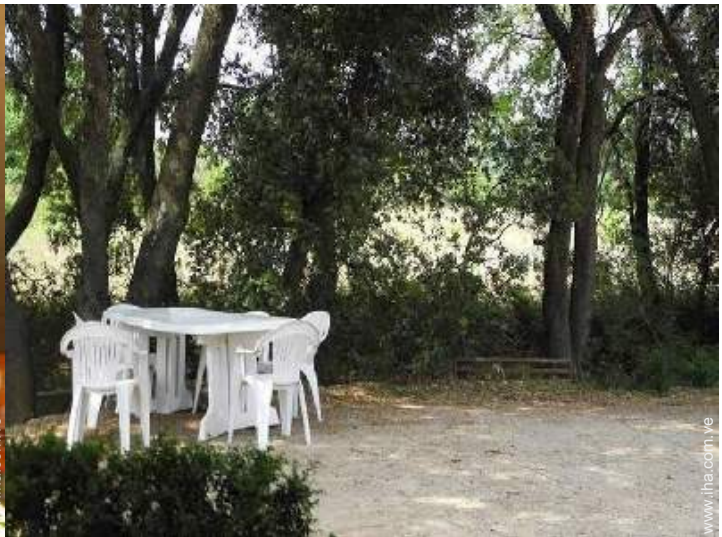
vista sobre el patio