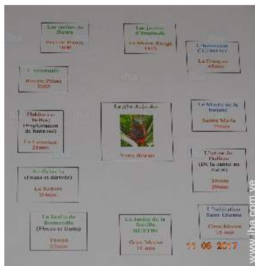
parque y jardín