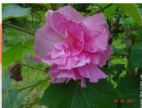
vista desde la terraza cubierta