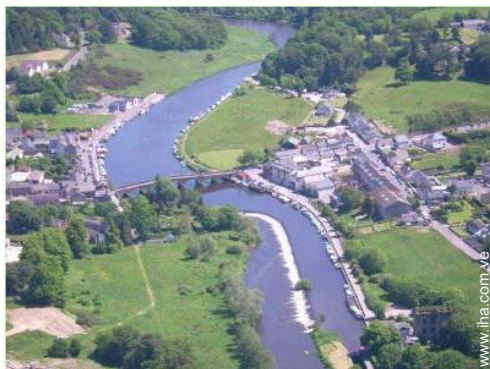
vista sobre el río