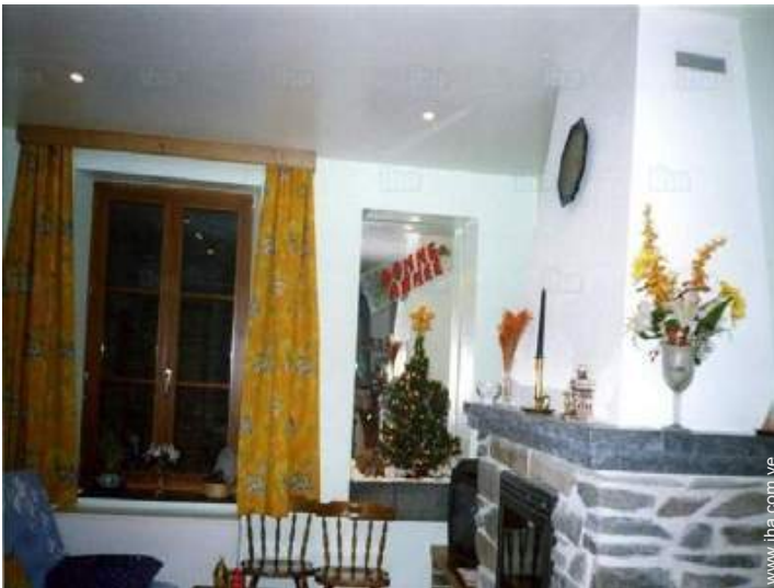
estufa de madera