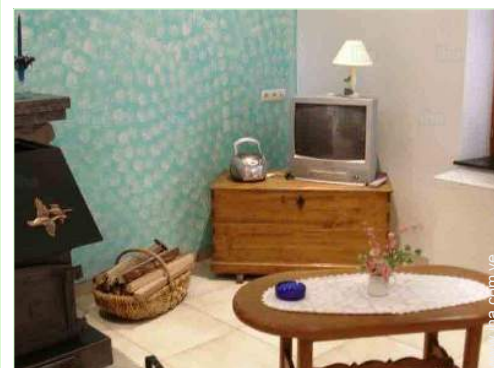
vista desde el salón