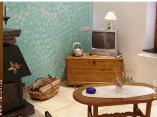
vista desde el salón