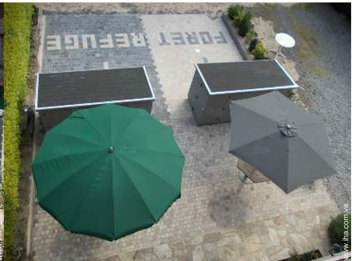
Instalación exterior a disposición de los huéspedes