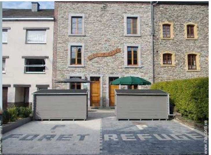
Marco exterior a disposición de los huéspedes