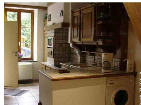
Instalaciones a disposición

Centro del pueblo 200m Parada/estación de guagua 200m Alquiler de bici/MTB Panadería Catering Pequeños comercios Supermercado Peluquería Correos Doctor