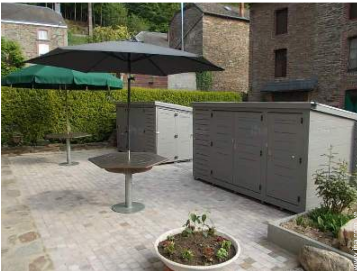
Instalaciones exteriores a disposición de los huéspedes