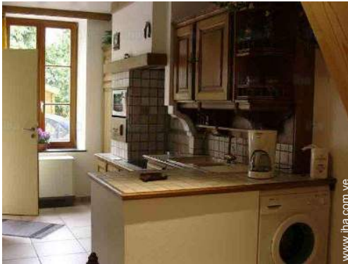
Instalaciones a disposición