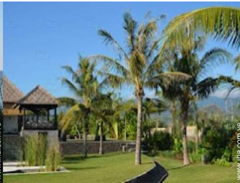
vista sobre el jardin/parque