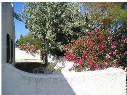
vista de conjunto