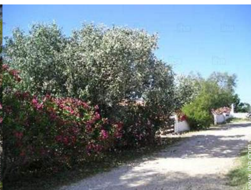
vista de la propiedad