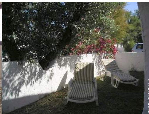
vista desde la casa