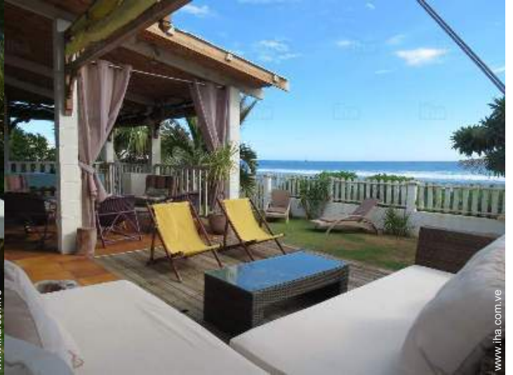
vista desde la veranda