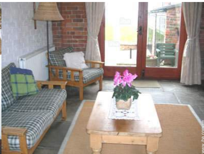
vista de la propiedad