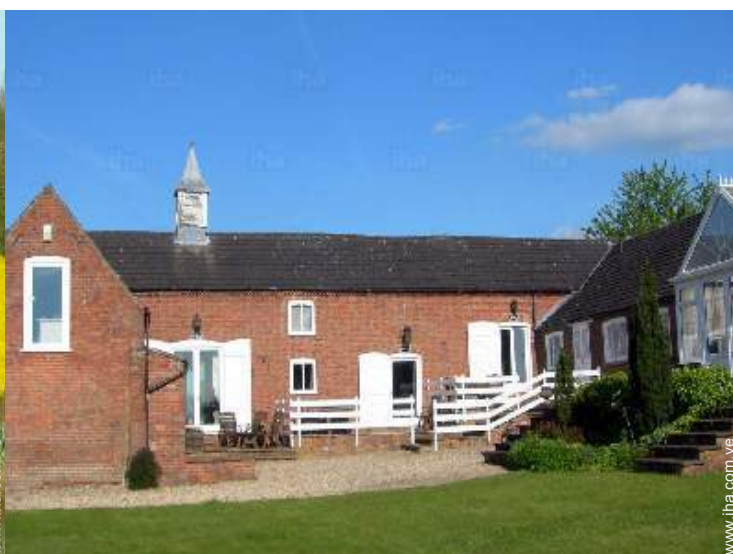
vista desde el jardín/parque