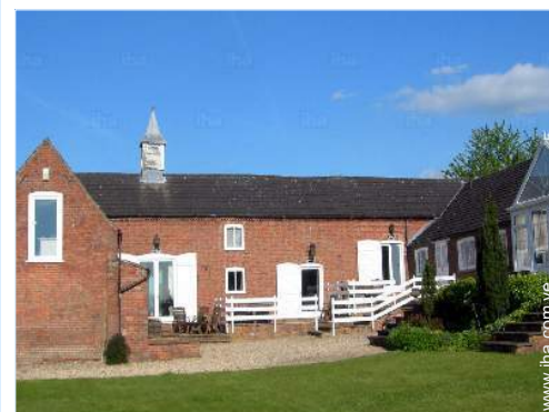
vista desde el jardín/parque