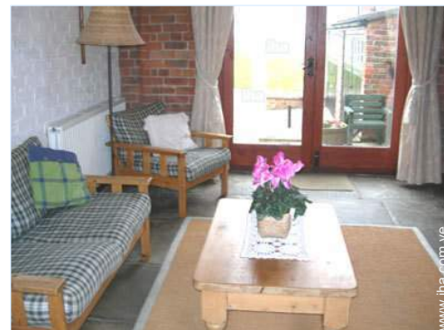
vista de la propiedad