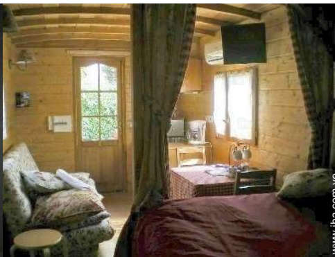
Confort interior e instalaciones