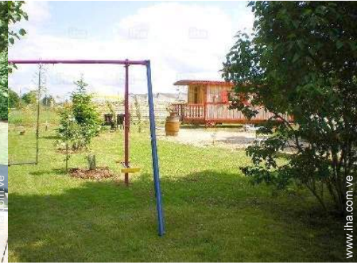
vista sobre el jardín/parque