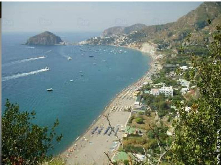
playa de arena