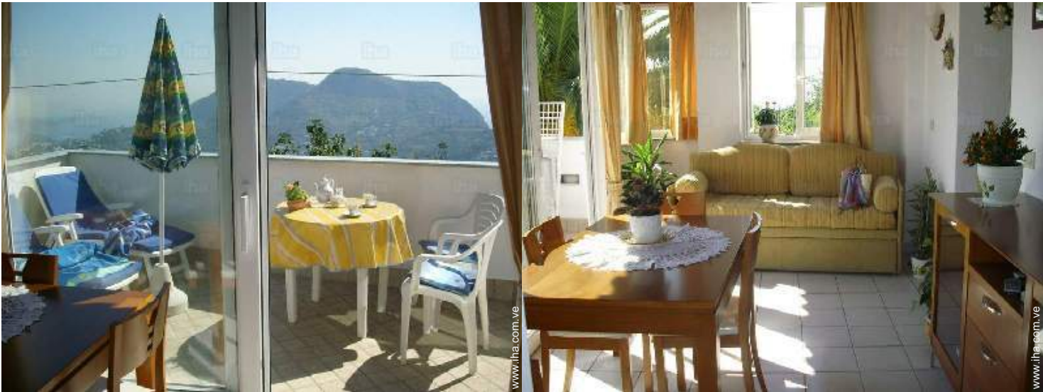
vista desde el cuarto de estar