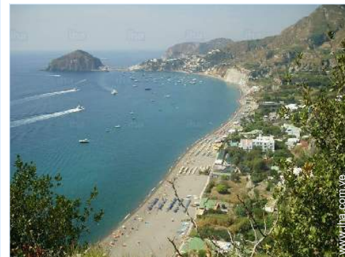
playa de arena

Centro del pueblo 800m El centro 7,5km Parada/estación de guagua 800m Alquiler de moto/escúter 2km Alquiler de carro 2km Alquiler de barco 7,5km Panadería 800m Pequeños comercios 800m Supermercado 800m Comercios de lujo y de marcas 7,5km Peluquería 2km Cibercafé 7,5km Correos 2km Banco 2km Farmacia 2km Doctor 3km Enfermera 10km Hospital 10km Dispensario 10km