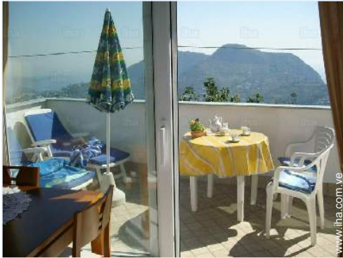
vista desde el cuarto de estar