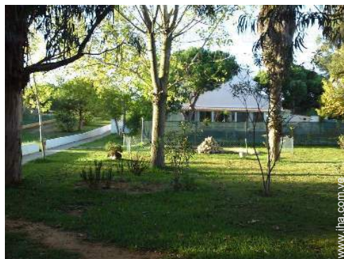
instalación de ocios